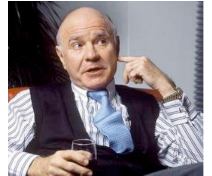
Marc Faber - Econoom en investerings guru

Goud: ‘We een lager niveau dan $ 1.000 niet meer terugzien’ Centrale Banker zijn allemaal hetzelfde. Ze zijn drukkers (van geld). Goud is wellicht goedkoper nu dan in 2001 volgens de rentepercentages. ‘Je moet baar Goud hebben’. Marc Faber verwacht dat Goud in de nabije toekomst richting de $ 4.000 zal gaan stijgen.